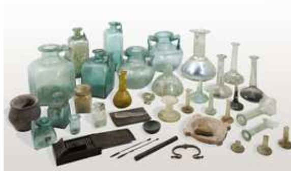
Ensemble issu de la tombe de l'oculiste gallo-romain de Saint-Médard-des-Prés