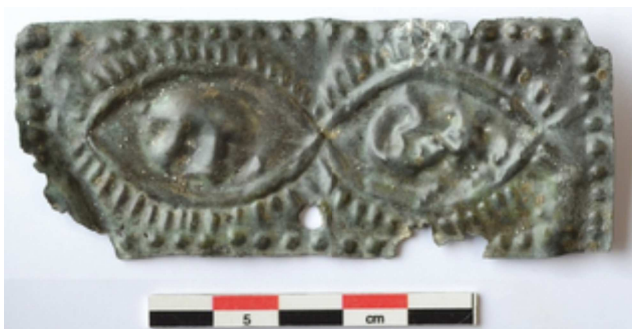
Ex-voto oculistique, Antiquité romaine - Musée des Traditions Populaires et d'Archéologie

Ces représentations font écho à une spécialité médicale bien connue en Gaule romaine : l'ophtalmologie. Cette médecine spécialisée faisait la notoriété de certains praticiens, les oculistes, dont la trousse professionnelle regorge de trésors pour les archéologues d'aujourd'hui.