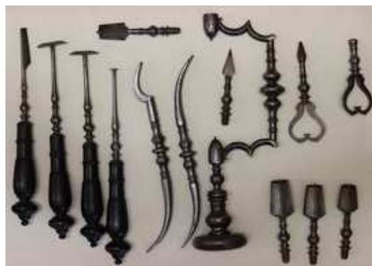
Instruments de la Trousse de trépanation attribuée à Ambroise Paré, XVI e siècle