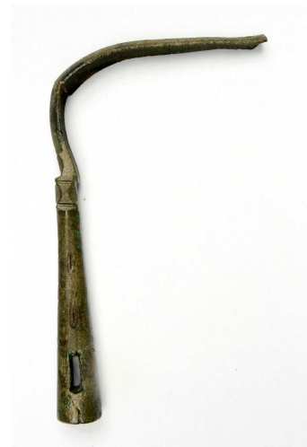
Strigile, Antiquité romaine Carré Plantagenêt – Musée d'archéologie et d'histoire du Mans